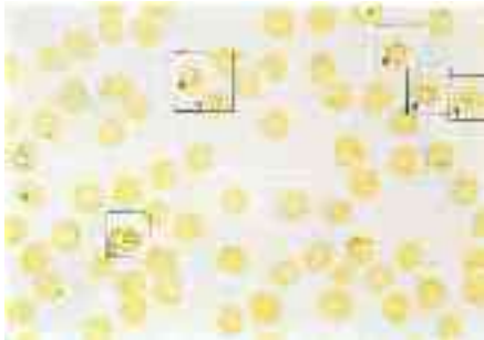
Bild 45 Fünf größere Krebserreger bei a. Der erwachsene Gamet bei b zeigt Granulation, ein Beweis des Stoffwechsels.

Die Tatsache, daß es bisher nicht gelungen ist, die einzelnen Zellbestandteile von belebten Krankheitserregern im Mikroskop sichtbar zu machen, sollte eher Ansporn für alle Mikroskopierenden sein.