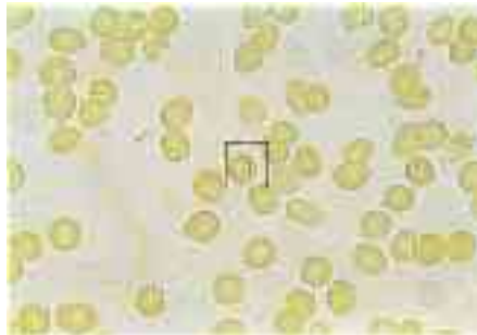
Bild 27 Zellwand, Plasma, Kernmembran, Kern, Nukleolus und das Zentralkörperchen des Ca-Plasmodiums sind zu erkennen.

Zum direkten mikroskopischen Nachweis eines belebten Erregers muß verlangt werden, daß durch die Färbemethode mindestens Zellwand, Zellplasma und der Zellkern dargestellt werden. Das Sichtbarwerden weiterer Zellorganelle ist wünschenswert (Bilder 27, 40, 41, 42, 45, 46, 53 und 56).