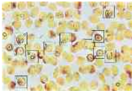
Bild 40 Im Blutausstrich der Krebskranken findet man die Ca-Plasmodien oft in größeren Grüppchen beisammen. Der fast erwachsene Gamet bei a zeigt sogar die beiden Zentralkörperchen. f bis h zeigen verschiedene Wirkungsgrade der Chininderivate.